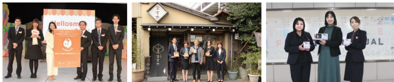
2022年実施支社 左から 大分支社、岐阜支社、青森支社 ※写真撮影時のみマスクを外しております。

奈良支社、熊本支社、東京支社、京都支社、池袋支社、広島支社、千葉支社、前橋支社、函館支社、高知支社、北九州支社、仙台支社、金沢支社、甲府支社、大分支社、岐阜支社、青森支社、松山支社、湘南支社の19支社