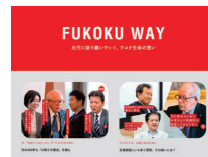
FUKOKU WAY (社史外伝)