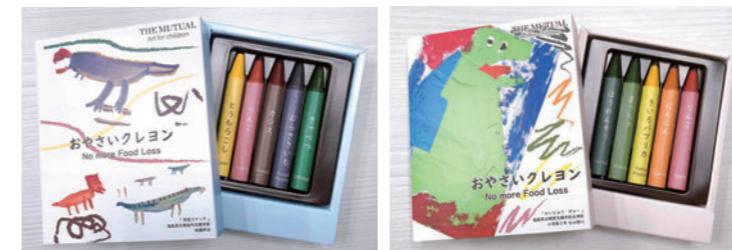
おやさいくレヨン第1弾

「おやさいくレヨン」は、多くの子どもたちに絵を描く楽しさを知ってほしいとの想いから、地域の保育園や幼稚園等を中心にお届けし、これまで33支社・本社で約46,000個を寄贈しました。また、捨てられてしまう野菜の外葉などを原材料としており、食材ロスの削減として、持続可能な開発目標(SDGs)の達成に向けた取組みの一つです。